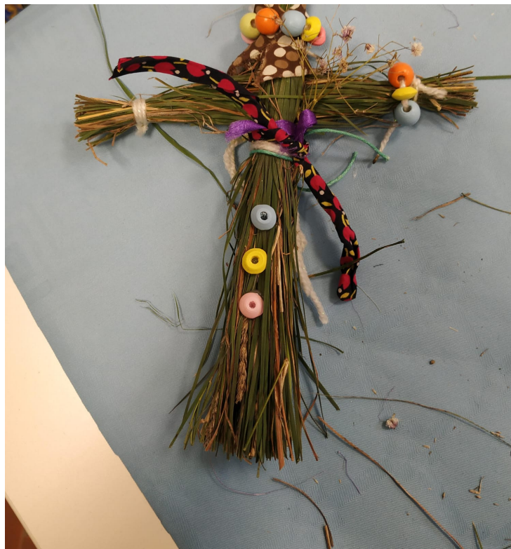
Куколка: народное творчество