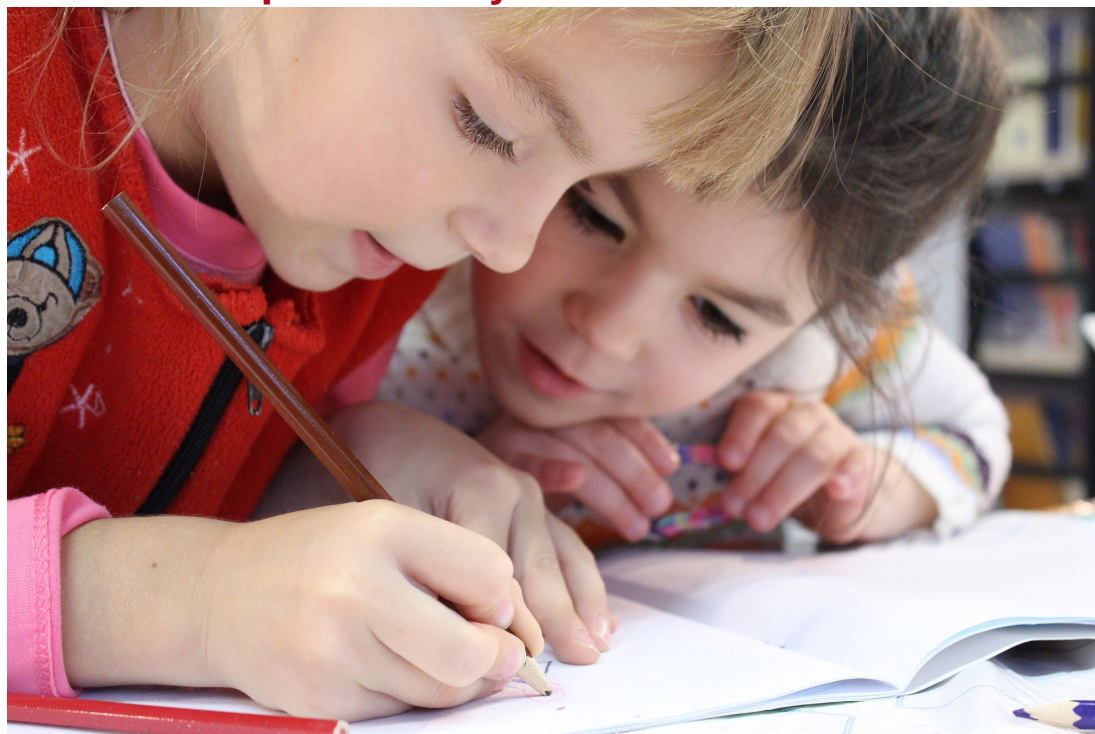
Русский язык и культура